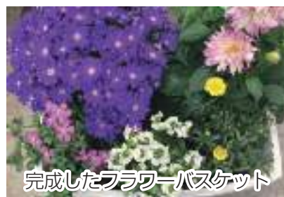
完成したフラワーバスケット

で作る豪華なフラワーバスケット】をテーマに、花が大きく塊根の残るダリアと、花が沢山咲くサイネリアをメインにした寄せ植えを行いました。部員の皆さんは、エル・パテオ、