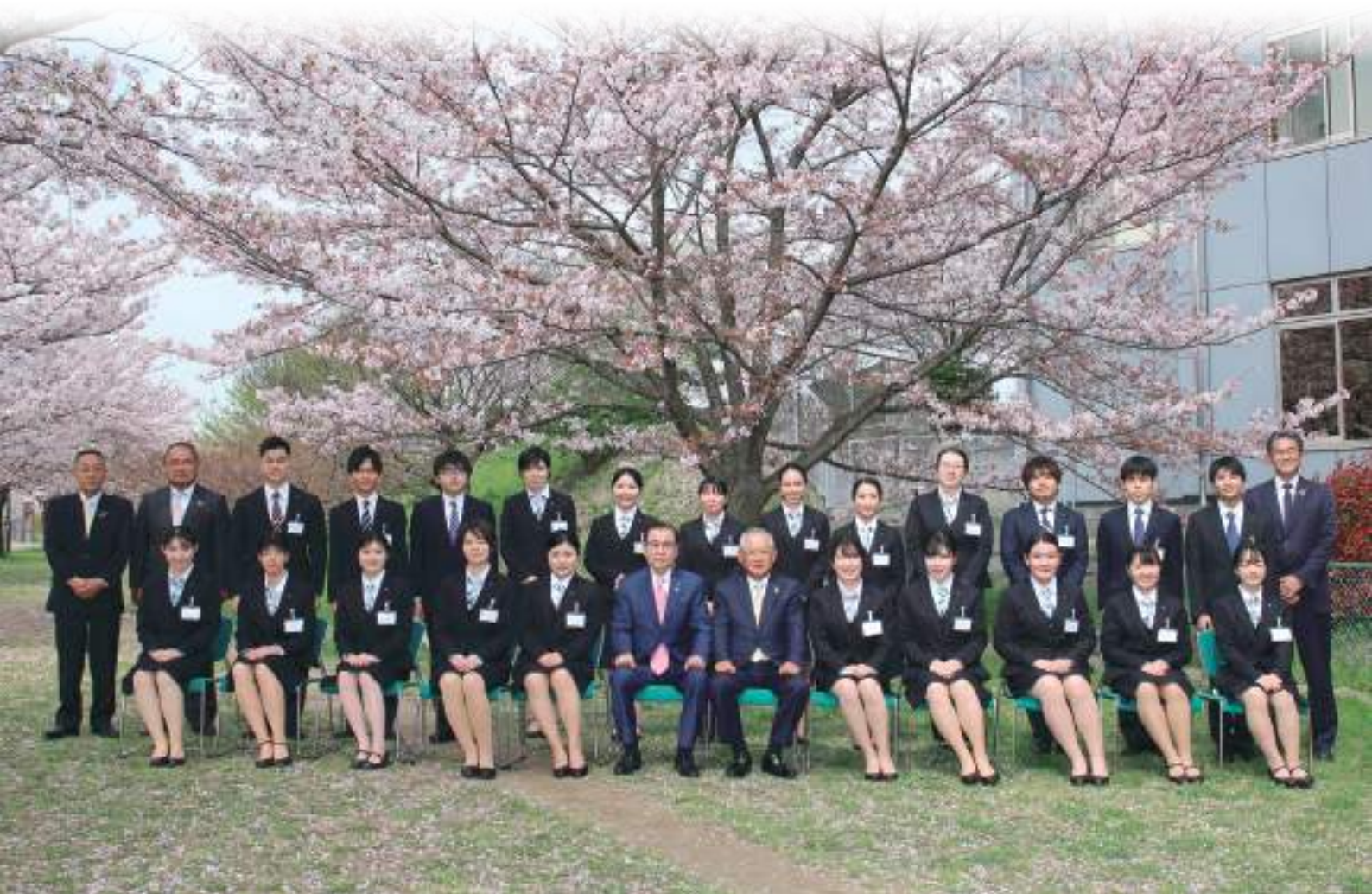
写真 当組合役員と共に