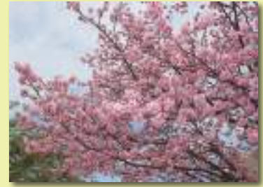
大堀川沿いの桜(柏市)