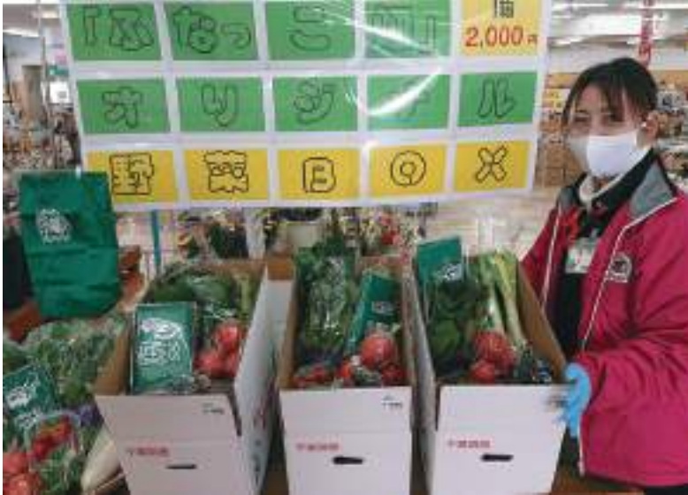
管内産野菜を入れた「ふなっこ畑」オリジナル野菜BOX

管内産野菜を中心としたこの野菜BOXは、買い物客からも「野菜の種類、品質が良くわかる」「少し買い足すだけで買い物が終わる」などと好評。農産物直売所「ふなっこ畑」では、コロナ禍終息後も販売を続ける予定です。