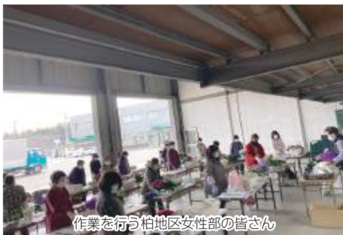
作業を行う柏地区女性部の皆さん

講習会には部員の皆さん30名が参加しましたが、昨年12月開催時と同様に、新型コロナウイルス感染予防のため、密にならないよう2部制にして行いました。この日は【樽型プランター