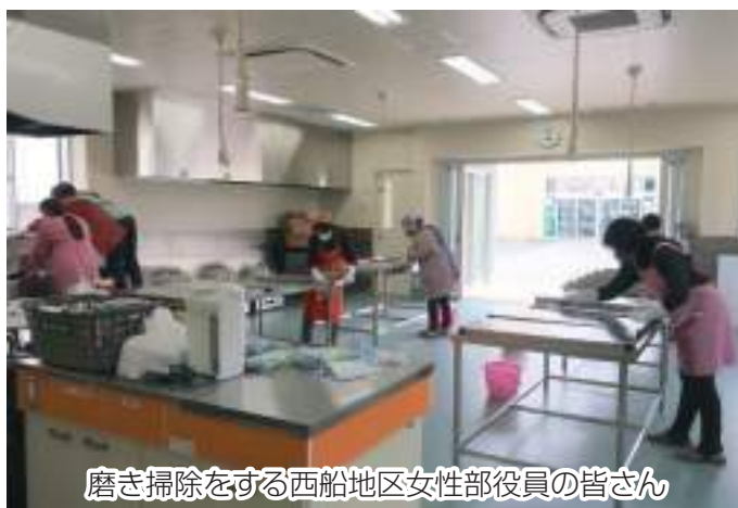
磨き掃除をする西船地区女性部役員の皆さん

同地区女性部では、毎年1月～2月に、この調理室を使って味噌の仕込み作業を行っています。作業最終日にも念入りに掃除をしますが、数日経つと思わぬ場所に錆が出てしまうことがあります。そこでこの錆付きを防ぎ、多くの皆さんに調理室を気持ち良く使ってもらうと、毎年その年の役員さんが磨き掃除を行っています。役員の皆さん11名は隅々まで磨き上げ、今年度最後の仕事を終えました。