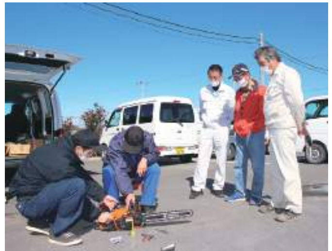
チェーンソーの修理を行う同農機センター職員

当JAとJA全農ちばが協同運営する県北西JA広域農機センターは、組合員の皆さんの利便を図ると共に、同農機センターの存在と業務を遠方に住む組合員の皆さんにも周知してもらおうと、東部地区、西船地区両経済センターで農機の点検会（修理も行っています）を行っています。